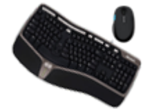
Клавиатуры и комплекты