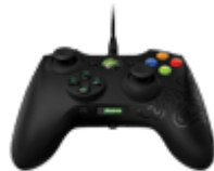
Геймпады, джойстики, рули