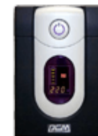
Источники бесперебойного питания