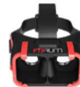
Очки и шлемы виртуальной реальности